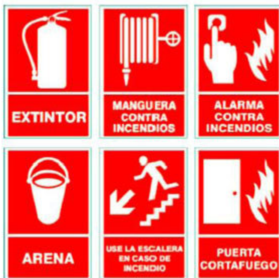
Imagen Nº 10. Señales de Lucha y Equipamiento contra el fuego Autor: Elaboración propia

Señales de equipos de lucha contra el fuego o antincendios: Proporcionan información sobre la localización de los equipos.