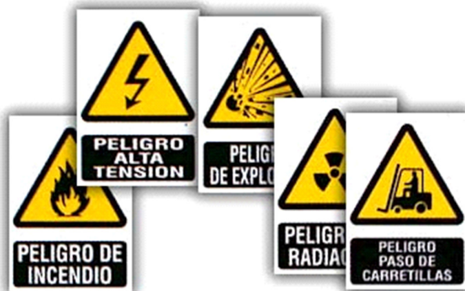
Imagen Nº 7. Señales de Peligro Fuente: Xunta de Galicia Autor: Pedro Landín

Señales de peligro o riesgo: Advierten de los posibles peligros que puede suponer el empleo de algún material, herramienta o máquina.