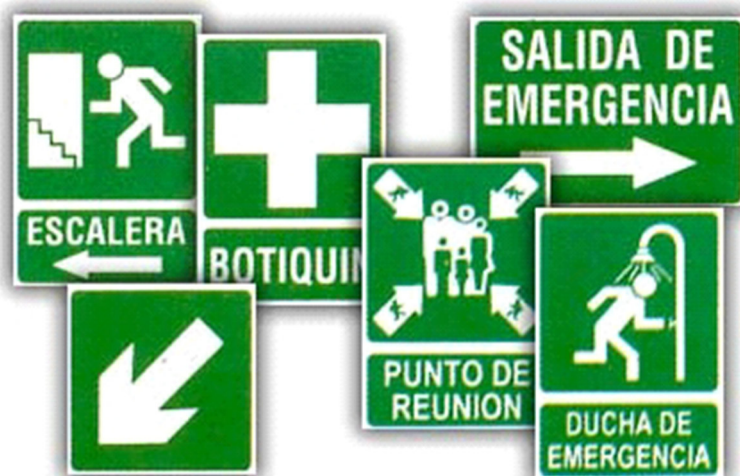
Imagen Nº 9. Señales de Auxilio y Salvamento Fuente: Xunta de Galicia Autor: Pedro Landín

Señales de auxilio o salvamento: Proporcionan información sobre la localización de los equipos de auxilio y de las rutas de escape.