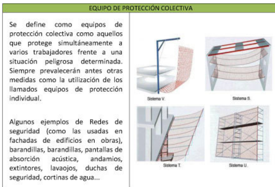
Imagen Nº 4. Equipo de Protección Colectiva.