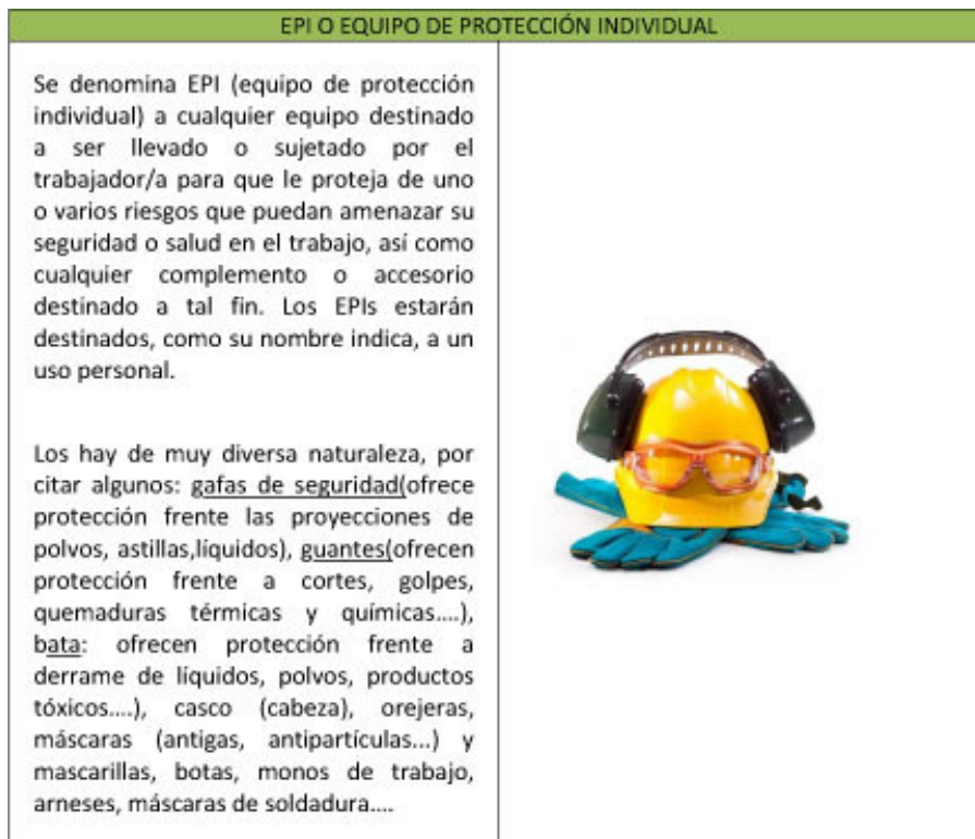
Imagen Nº 3. Equipo de Protección Individual

Cuando hablamos de normas de seguridad debemos de tener en cuenta el uso de protecciones individuales y colectivas, teniendo en muy en cuenta que estos equipos protegen en caso de accidente pero no lo previenen. Así tenemos el EPI y los Equipos de protección colectiva.