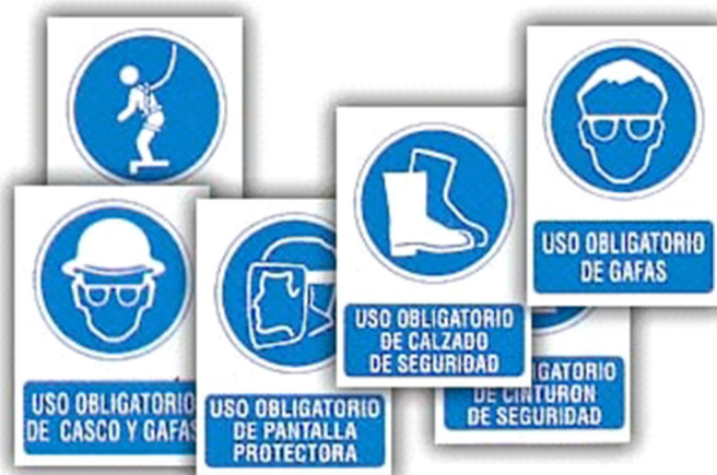
Imagen Nº 6. Señales de Obligación Fuente: Xunta de Galicia Autor: Pedro Landín

Señales de obligación: Avisan de la obligatoriedad de emplear protección adecuada con el fin de evitar accidentes.