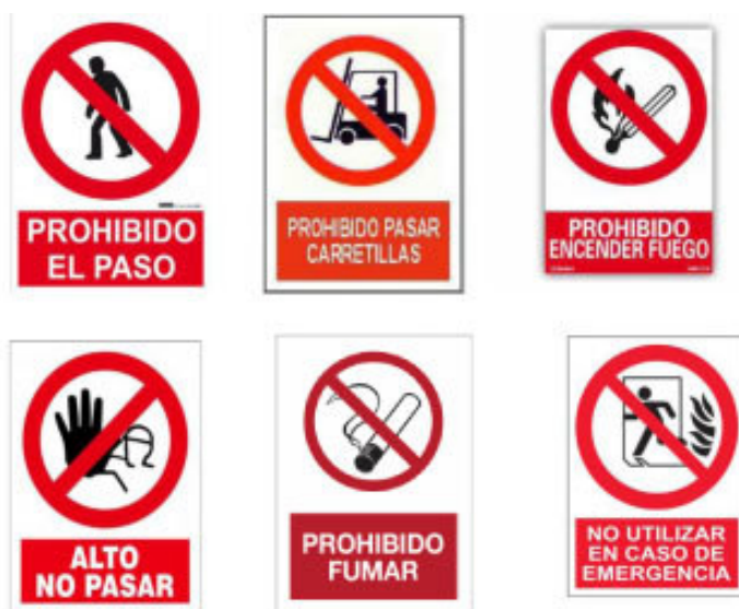
Imagen Nº 8. Señales de Prohibición

Señales de prohibición: Avisan de la imposibilidad de realizar ciertas actividades que ponen en peligro la salud del trabajador y de sus compañeros.